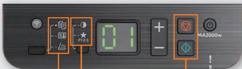
Panel de operaciones

El dispositivo cuenta con una herramienta cliente sencilla y fácil de usar (KYOCERA Client Tool) y un panel de operaciones con el que los usuarios podrán imprimir y escanear sus documentos de forma sencilla.